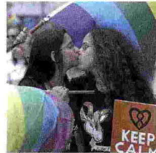
Roma. Una coppia manifesta per registrare le unioni civili 2015 a Roma.