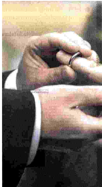
Scambio di fedi. Nozze tra due uomini in America.

“In settimana si potrebbe iniziare a votare in commissione e poi passare all'aula”